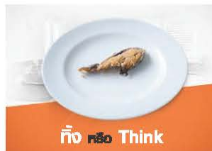
ถึง หรือ Think

คิดให้ดี...คุณจะได้เห็น คุณค่าที่แท้จริง