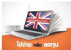
ใช้ง่าย หรือ ลอกๆ

คิดให้ดี...คุณจะได้เห็น เงินเหลือเก็บ ความสุขเหลือใช้