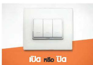
เปิด หรือ ปิด

คิดให้ดี...คุณจะได้เห็น ความสุข บนความพอดี