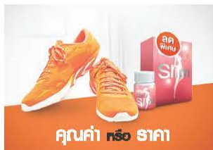
คุณค่า หรือ ราคา

คิดให้ดี...คุณจะได้เห็น คุณค่าที่แท้จริง