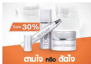
ตามใจ หรือ ตัดใจ

คิดให้ดี...คุณจะได้เห็น ความประหยัด ที่สร้างสุข