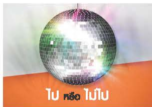
ไป หรือ ไม่ไป

ธนาคารธนชาติ จำกัด (มหาชน) เปิดตัวภาพยนตร์โฆษณาภายใต้โครงการ Rethink by Thanachart ชื่อชุด“เสี้ยววินาทีคิด” ก่อนตัดสินใจ...ก่อนใช้...ก่อนซื้อ ล้วนเป็นเสี้ยววินาทีที่สำคัญ ที่จะเปลี่ยนชีวิตคุณให้มีความสุขได้