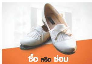
ซื้อ หรือ ช่อม

คิดให้ดี...คุณจะได้เห็น ความพอเพียง ที่อบอุ่น