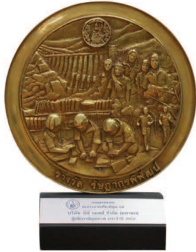
รางวัล "รัชฎากรพัฒนา"

บริษัท ซีพี ออลล์ จำกัด (มหาชน) ผู้บริหารเซเว่น อีเลฟเว่น ร้านอัมสะดวกของคนไทย และผู้บริหารระดับสูงของบริษัทรับรางวัลเกียรติยศ 4 รางวัลซ้อนในปลายปี 2553 คือ