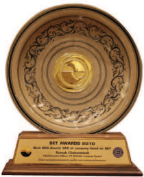
รางวัล ผู้บริหารสูงสุดยอดเยี่ยม "Best CEO"

รางวัลชนะเลิศอันดับ 1 ในกลุ่มผู้ดำเนินธุรกิจค้าปลีกของเมืองไทย มอบให้โดย นิตยสาร รีเทล เอเชีย ร่วมกับ ยูโรมอนิเตอร์ อินเตอร์เนชันแนล และ เคพีเอ็มจี ในงาน "Retail Asia-Pacific Top 500 Ranking 2010 Awards"