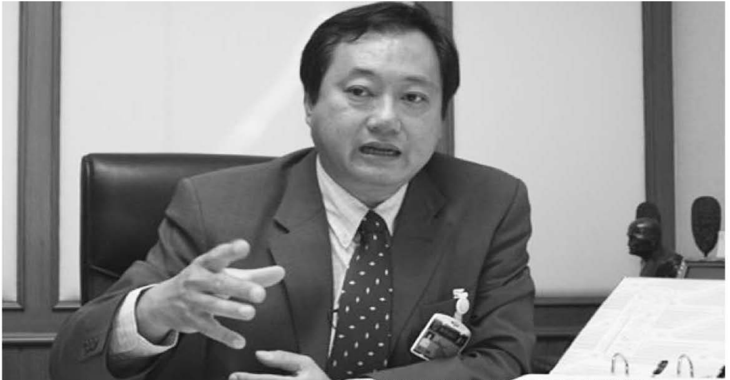
REFORM : THE MEDIA THE MINDS THE MESSAGE

"เมื่อวุฒิสภามีปัญหา ทำให้กระบวนการเลือก กสทช. มีปัญหา เราก็เลยได้คนที่ไม่เหมาะสมมาบริหารจัดการกำกับดูแลสื่อวิทยุโทรทัศน์ คนกำกับกติกามีปัญหา การออกกติกาก็มีปัญหา คนที่จะมาตรวจสอบเจอปัญหา มันเป็นวงจรแบบนี้"