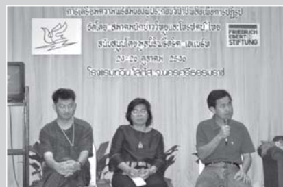
(ภาพชุดบน) ภาคตะวันออก

จัดขึ้นในวันศุกร์ที่ 10-อาทิตย์ที่ 12 ตุลาคม 2546 ณ โรงแรมนิว แทรเวลลอร์ดจ จ.จันทบุรี